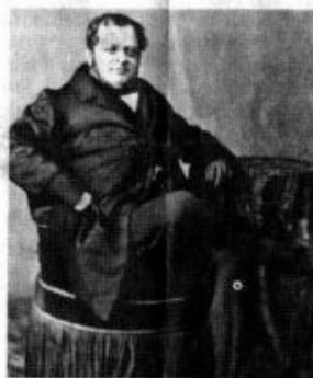
Camillo Benso conte di Cavour

padronale, sopra il portone barocco. E' grigia, con rilievi più chiari.