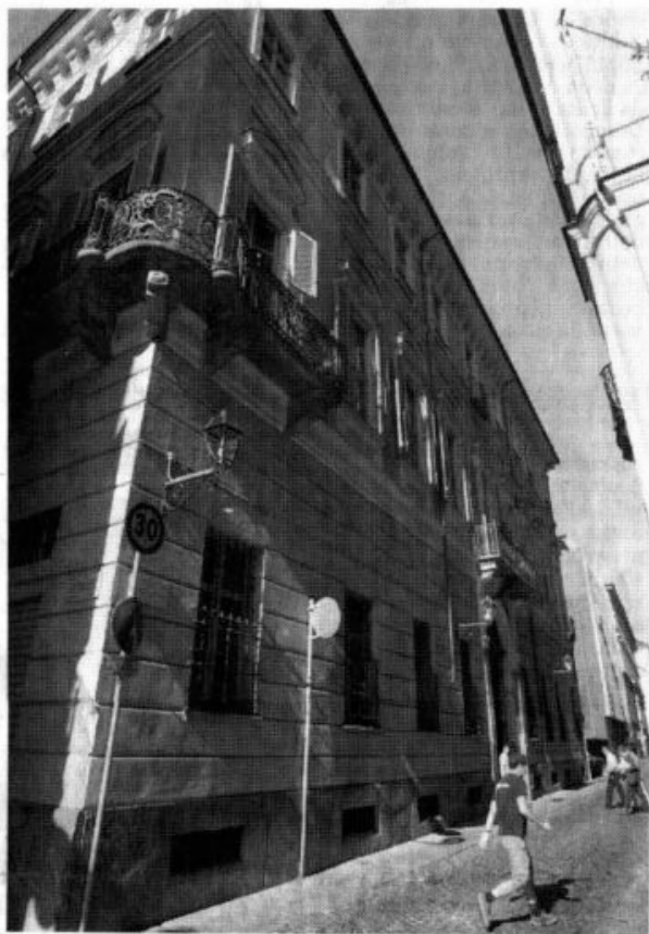
Palazzo Capris, all'angolo tra via Santa Maria e via Botero